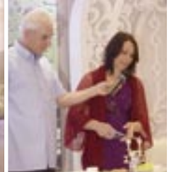
講員：以色列·以路斯傳道 (以色列台拉維夫救恩之角)