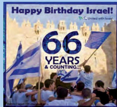
2014年以色列立國66週年