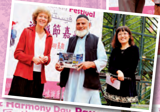
這年我們在佐敦道馬路中間的街燈柱上高掛此旗幟