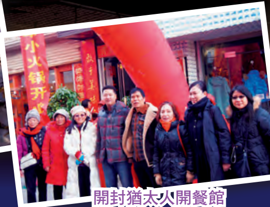
開封猶太人開餐館