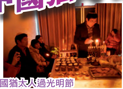
與中國猶太人過光明節