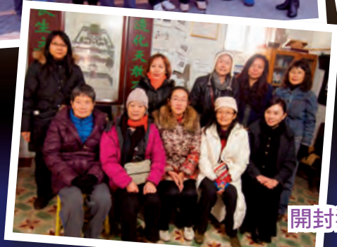
開封猶太會堂舊址