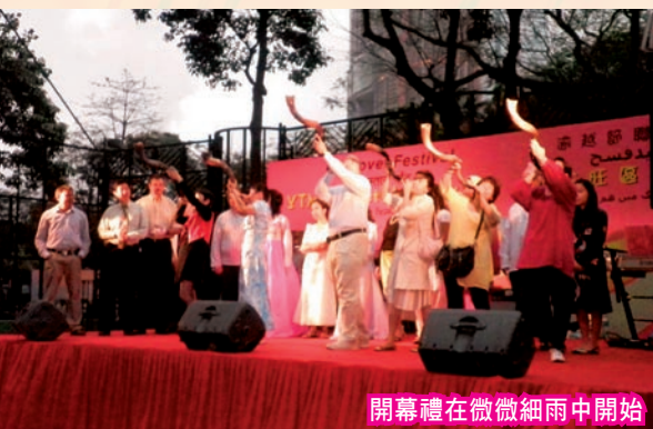
開幕禮在微微細雨中開始