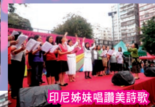
印尼姊妹唱讚美詩歌