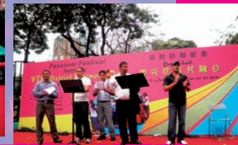
巴基斯坦弟兄分享民族歌曲