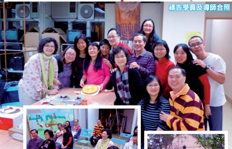
禱告學員及導師合照

2011年1月榮耀事工與友好機構金路發展一起推出以色列禱宣課程，這個二年制課程主要教導關於以色列文化、節期、希伯來文及詩歌，古道——猶太根源的醫治釋放，怎樣為以色列禱告及向猶太人分享福音，實踐以禱告承托宣教。