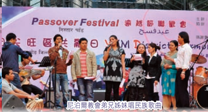
尼泊爾教會弟兄姊妹唱民族歌曲