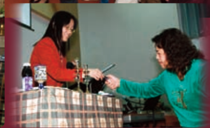
與猶太人社群接觸 2010年4月25日