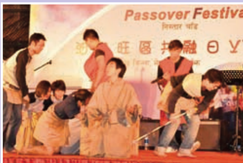
默劇：從為奴之地得拯救