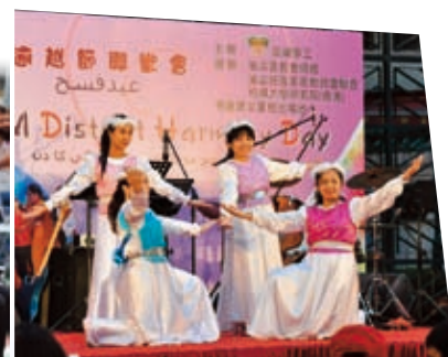
印尼姊妹演出民族舞蹈