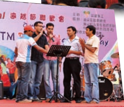
巴基斯坦弟兄獻唱詩歌