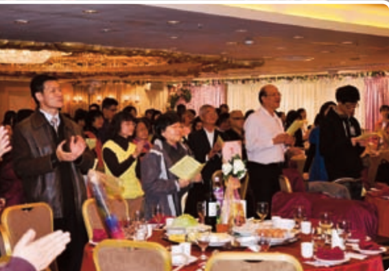
2010年逾越節晚餐 3月29日