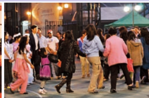
齊參與：按感動隨樂聲起舞