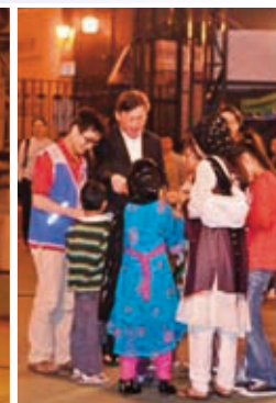
協助決志者填寫回應表