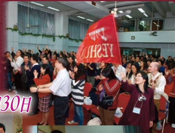
澳門逾越節晚餐 2010年3月30日