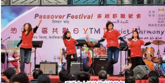
香港本土姊妹演出搖鼓舞