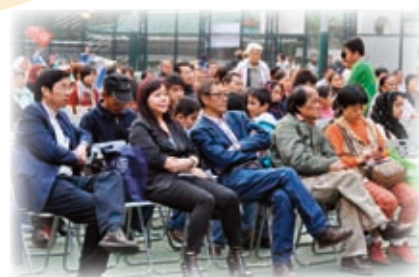
油尖旺區共融日：約有300人參加