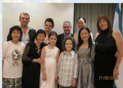
*跟總領事（後排右二）及 總領事夫人（前排右一）合照