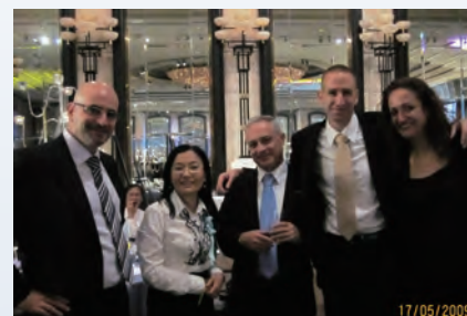
*同工及義工共10人應香港猶太婦女會邀請，於5月17日晚出席記念以色列復國61週年籌款晚會，並於席上獻唱希伯來文詩歌