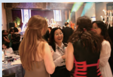
*聚會中彼此問候建立友誼

我深信愛他們的以色列 神必然快快施行祂的拯救，讓分散各處的猶太人不但回歸 神所應許給他們的以色列（迦南）地，更是如浪子一般回歸祂的懷抱，得著原是屬於他們的福氣。