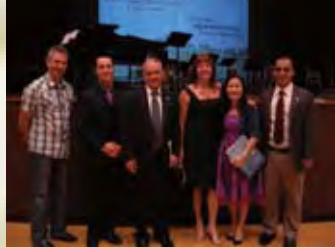
*以色列總領事伉儷蒞臨會場

撒冷信徒的窮人中(羅15：25-27)。本著聖經教導，我們對現時以色列教會的需要，也該擺上我們的一份。所以本會除了為以色列及列國禱告求復興外，還有對以色列猶太彌賽亞信徒教會、機構、牧者及肢體在金錢上作實質援助。