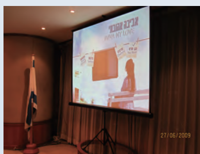
*同工及義工於6月27日 應邀觀賞以色列電影Aviva My Love