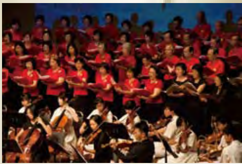
*香港浸信會聯會陽光詩班

本會沒有任何背景支持，一切都是憑信心過活；然而，事工發展初期已成立「 愛以色列專款 」，呼籲弟兄姊妹對以色列的福音事工作出奉獻。我們收集到奉獻後，會定時送到以色列不同教會及機構。以色列有超過五分之一人口，即一百多萬人活在赤貧當中。當地服事貧窮人的教會及機構都面臨很大的財赤，部份牧者更需要織帳棚為生。