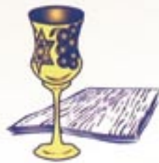
Pesakh/Hag HaMatzot Passover/Unleavened Bread

今日我們舉辦逾越節晚餐也有兩個主題，第一個主題是記念耶穌成為這個逾越節的羔羊。這位無殘疾的羔羊(無罪的)，為我