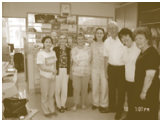
2005年逾越節前來自以色列的猶太人相聚一刻